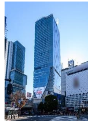
▲渋谷スクランブルスクエア外観

名 称： 渋谷スクランブルスクエア／SHIBUYA SCRAMBLE SQUARE 事業主体： 東急(株)、東日本旅客鉄道(株)、東京地下鉄(株) 所 在： 東京都渋谷区渋谷2丁目24番12号 用 途： 事務所、店舗、展望施設、駐車場など 延床面積： 第Ⅰ期（東棟）約181,000㎡、第Ⅱ期（中央棟・西棟）約96,000㎡ 階 数： 第Ⅰ期（東棟）地上47階 地下7階、 第Ⅱ期（中央棟）地上10階 地下2階、（西棟）地上13階 地下5階 高 さ： 第Ⅰ期（東棟）約230m、第Ⅱ期（中央棟）約61m、（西棟）約76m 設 計 者： 渋谷駅周辺整備計画共同企業体 ※(株)日建設計、(株)東急設計コンサルタント、(株)JR東日本建築設計、 メトロ開発(株) デザイナー・アキアト： (株)日建設計、(株)隈研吾建築都市設計事務所、(有)SANAA 事務所 運 営 会 社： 渋谷スクランブルスクエア(株) ※東急(株)、東日本旅客鉄道(株)、東京地下鉄(株)の3社共同出資 開 業： 第Ⅰ期（東棟）2019年11月1日 第Ⅱ期（中央棟・西棟）2027年度 U R L： https://www.shibuya-scramble-square.com