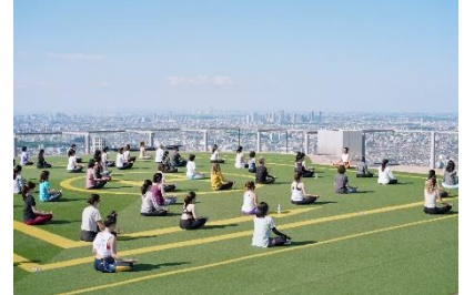
▲前回の開催時の様子